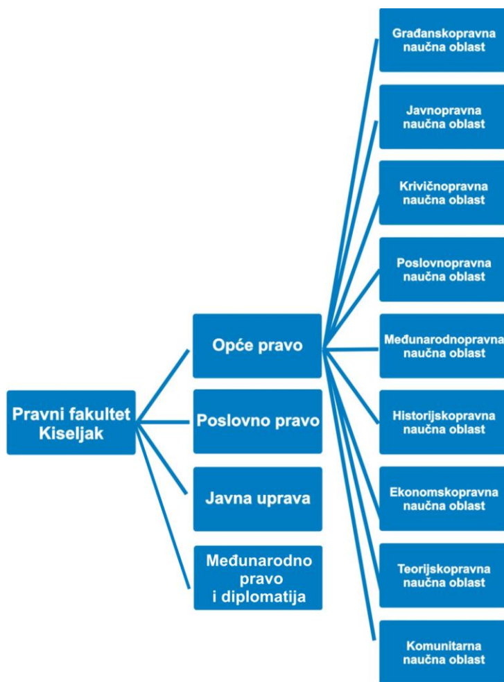
Slika 2. Dijagram strukture studijskih programa

U nastavku se daju osnovne karakteristike predviđenih programa.