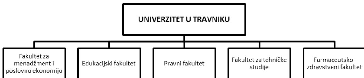
Slika 1. Prikaz organizacijskih jedinica Univerziteta u Travniku

Univerzitet u Travniku, menadžment Univerziteta i sve njegove sastavnice maksimalno afirmativno prilaze spomenutim pravcima razvoja, uz saznanje da su univerziteti danas, kako u BiH, jednako tako i u cijeloj Evropi, primarno orijentisani na transfer znanja i tehnologija prema ciljanim društvenim grupama, poslovnim subjektima ili općenito na akumulaciju znanja i prijenos tih znanja novim generacijama. U tom kontekstu, UNT svakako jeste generator selekcije određenih u društvu aktueliziranih i atraktivnih studijskih programa za koje je vrlo vjerovatno da kapacitete finalne produkcije može realno i relativno lahko, apsorbirati tržište rada.