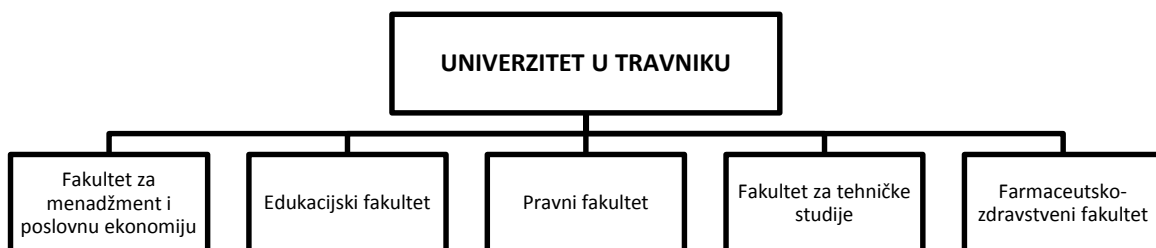
Slika 1. Prikaz organizacijskih jedinica Univerziteta u Travniku

Univerzitet u Travniku, menadžment Univerziteta i sve njegove sastavnice maksimalno afirmativno prilaze spomenutim pravicima razvoja, uz saznanje da su univerziteti danas, kako u BiH, jednako tako i u cijeloj Evropi, primarno orijentisani na transfer znanja i tehnologija prema ciljanim društvenim grupama, poslovnim subjektima ili općenito na akumulaciju znanja i prijenos tih znanja novim generacijama. U tom kontekstu, UNT svakako jestegenerator selekcije određenih u društvu aktueliziranih i atraktivnih studijskih programa za koje je vrlo vjerovatno da kapacitete finalne produkcije može realno i relativno lahko, apsorbirati tržište rada.