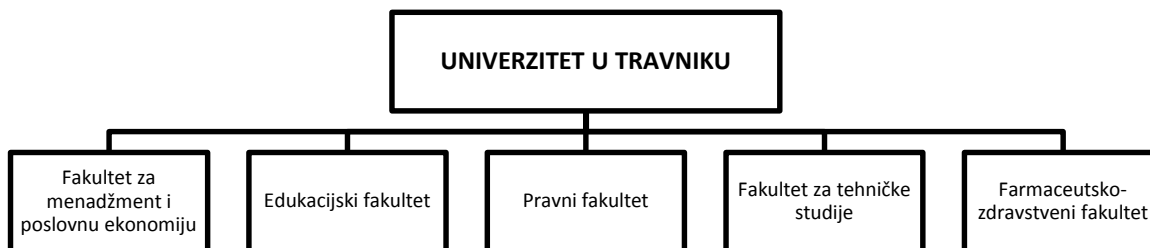
Slika 1. Prikaz organizacijskih jedinica Univerziteta u Travniku

Univerzitet u Travniku, menadžment Univerziteta i sve njegove sastavnice maksimalno afirmativno prilaze spomenutim pravicima razvoja, uz saznanje da su univerziteti danas, kako u BiH, jednako tako i u cijeloj Evropi, primarno orijentisani na transfer znanja i tehnologija prema ciljanim društvenim grupama, poslovnim subjektima ili općenito na akumulaciju znanja i prijenos tih znanja novim generacijama. U tom kontekstu, UNT svakako jestegenerator selekcije određenih u društvu aktueliziranih i atraktivnih studijskih programa za koje je vrlo vjerovatno da kapacitete finalne produkcije može realno i relativno lahko, apsorbirati tržište rada.