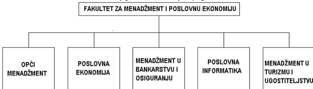
Slika 2. Dijagram strukture studijskih programa.

U nastavku su date osnovne karakteristike predviđenih programa.