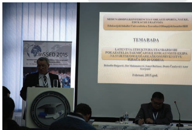
Konferencijski blok: Transformacioni procesi