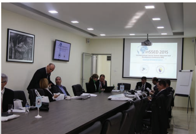
VIP sala za prijem gostiju