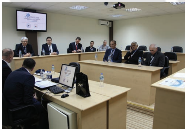
Sastanak dekana i predstavnika fakulteta učesnika konferencije InSSED 2015

Po završetku rada po konferencijskim blokovima usmenih predavanja u 16 sati, u Multimedijalnoj sali, dekani i predstavnici fakulteta su imali sastanak na kojem su potpisali zajednički protokol prijateljstva i saradnje.