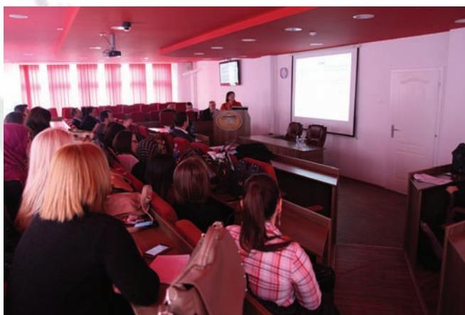
Konferencijski blok predavanja iz oblasti odgojnih nauka, jezika i književnosti